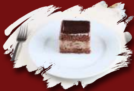
Çikolatalı Yaş Pasta