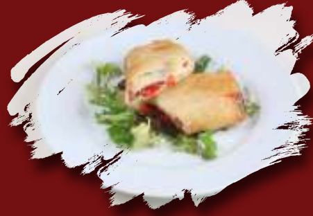
Pastırmalı Paçanga Böreği