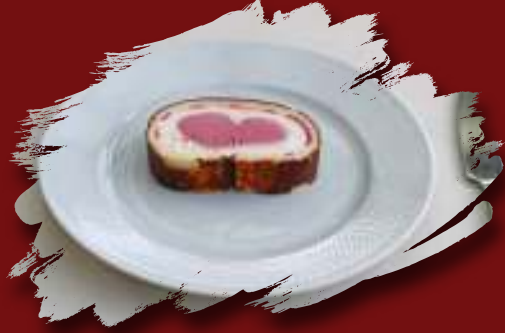
Dondurmalı Yaş Pasta