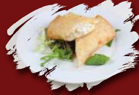
Peynirli Paçanga Böreği