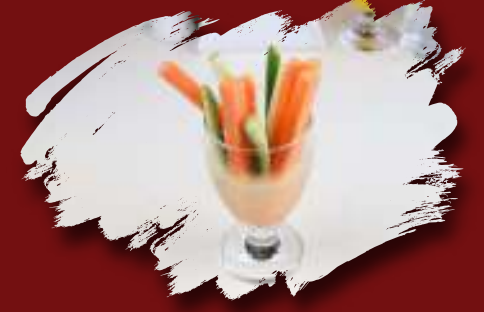
Havuç Salatalık Kokteyl